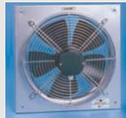
Wandventilator Typ: Axial bis 1m Durchmesser