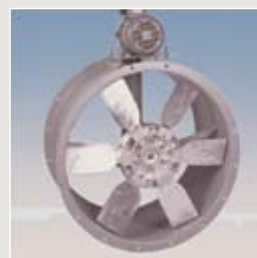
Motor außerhalb bis 150 °C

Krull Elektromotoren GmbH Hüttenstraße 10 30165 Hannover Telefon: 05 11 / 93 76 99-0 Telefax: 0511 / 93 76 99-29 eMail: krull@krull-elektromotoren.de