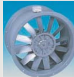
Rohrventilator Typ: Axitub von 250 bis 1250 mm