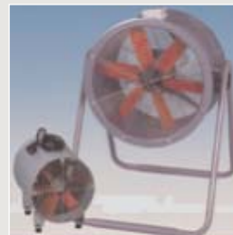
Standventilatoren Typ: Portatil bis 710 mm