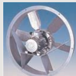
Befestigungsring Typ: Axian bis 1,25 m